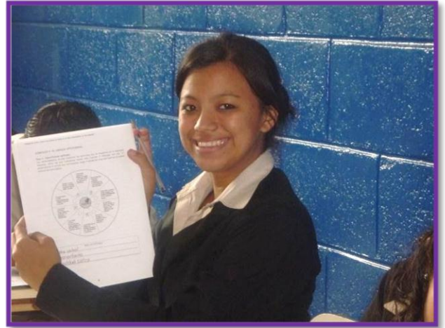
"Alumna del INSO, realizando actividad en el Cuadernillo Pre-laboral"

Durante el mes de julio se ha dado inicio a las jornadas del programa de orientación Pre-laboral, con un nuevo grupo de alumnos y alumnas del tercer año del Instituto Nacional de Soyapango , como parte de la estrategia de descentralización de los servicios ofrecidos desde CRJ.