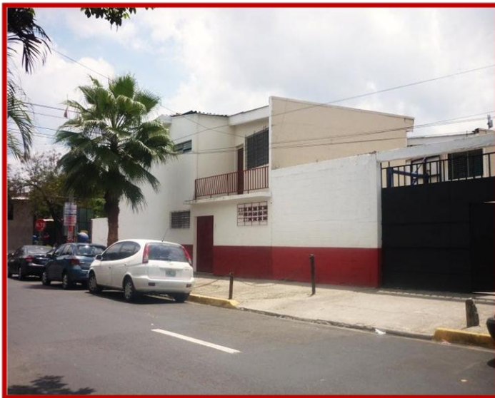
"Nuevas instalaciones de CRJ Soyapango"

A partir del mes de julio Centro Ruta Joven Soyapango se ha trasladado a un nuevo local ubicado en el Bo. El Centro, Calle Roosevelt Pte. N° 23 A, Contiguo al Mercado las Palmeras. Dicho traslado Obedece a una readecuación de las oficinas de atención a la población de la Alcaldía de Soyapango.