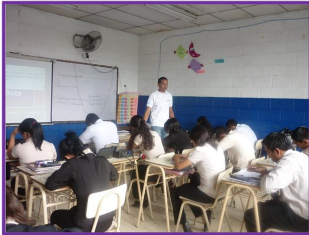
"Estudiantes del INSO, en la jornada del Taller Pre-laboral"