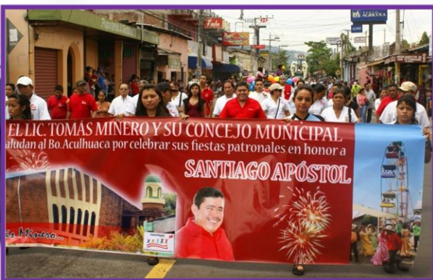
"Jóvenes de CRJCD, participando en el Desfile de Correos"