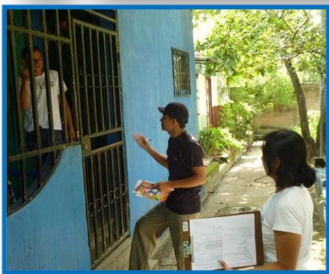
"Jóvenes de Centro Ruta Joven Apopa, haciendo visitas a viviendas aledañas al Centro"