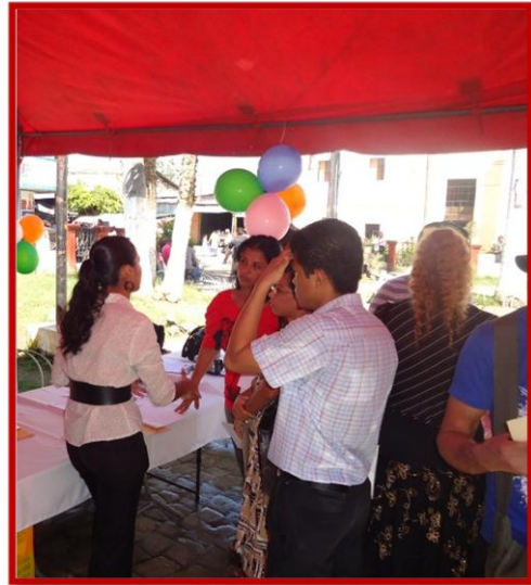
"Usuaria de CRJA informando a un grupo de jóvenes sobre el proyecto durante la Feria de Empleo"

A este esfuerzo se sumaron jóvenes de CRJA, colaborando con la promoción previa y la atención de las y los asistentes el día del evento. Así mismo se contó con un stand de la Ruta, el cual estuvo a cargo de cuatro chicas/cos, que apoyaron actividades de promoción, orientación e inscripción de las juventudes a Centro Ruta Joven.